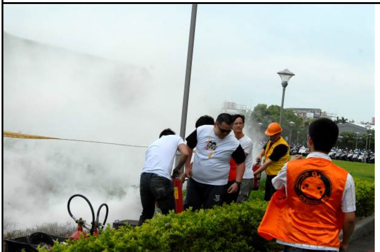
說明：滅火班滅火器油盆滅火訓練