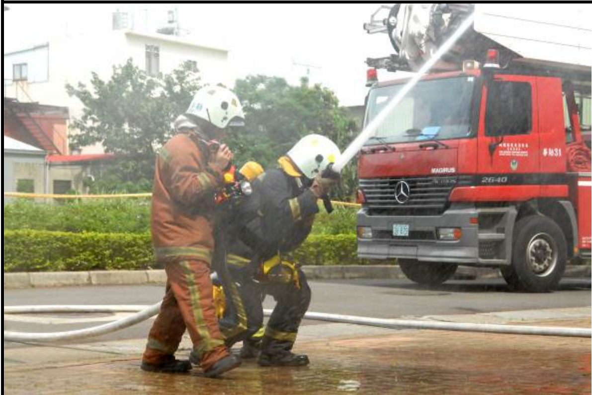
說明：縣政府消防隊滅火搶救