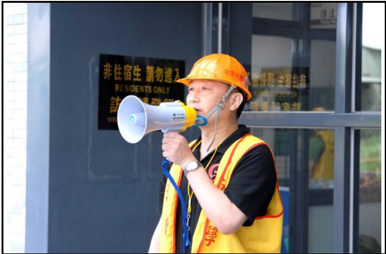
說明：自衛消防編組通報