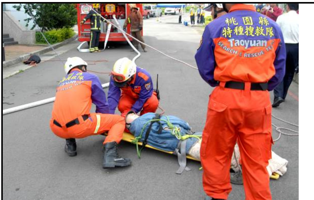
說明：高樓逃生救助演練