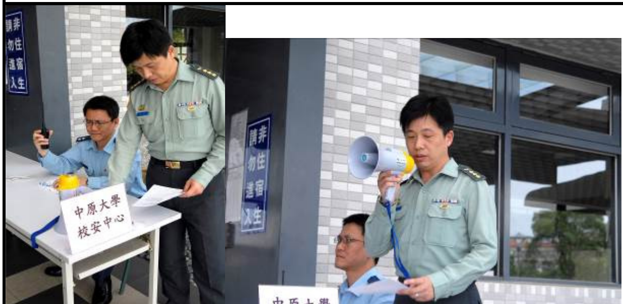
說明：校安中心通報