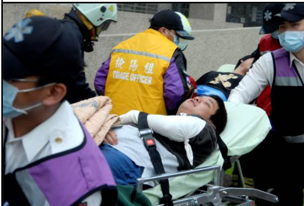
說明：消防隊傷患救助演練