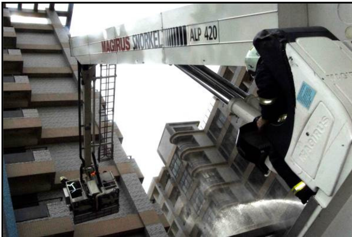
說明：雲梯車人員救助演練