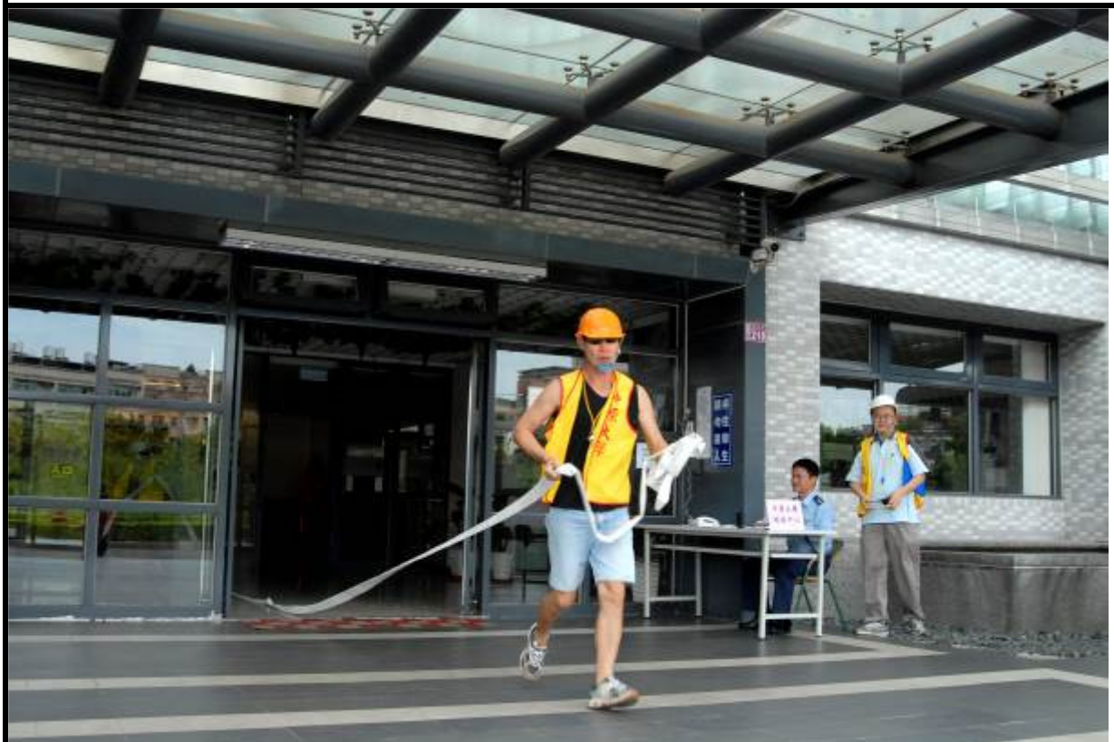
說明：防護團消防隊室內消防栓滅火訓練