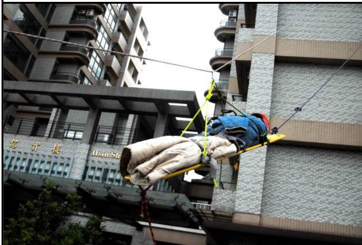
說明：高樓逃生救助演練