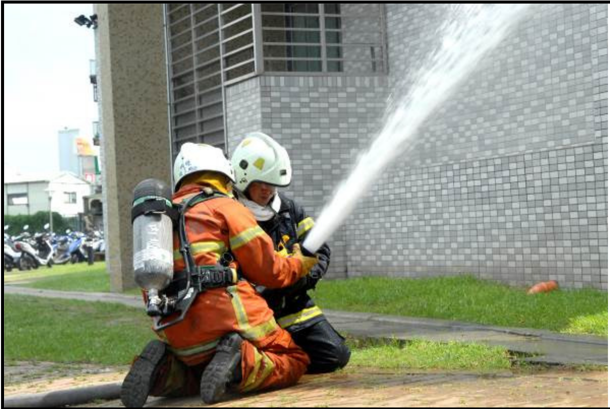
說明：縣政府消防隊滅火搶救