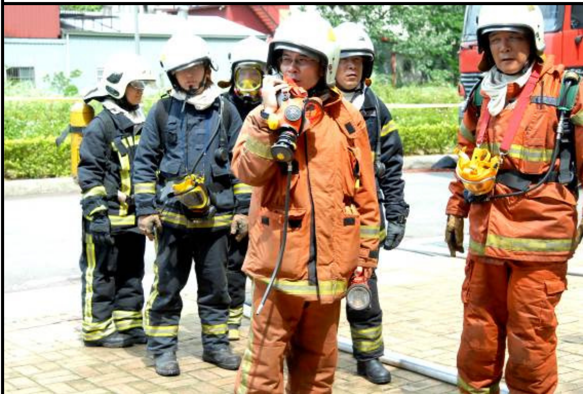
說明：救災人員清點 指揮官宣佈狀況解除 防護團-災後復原清理