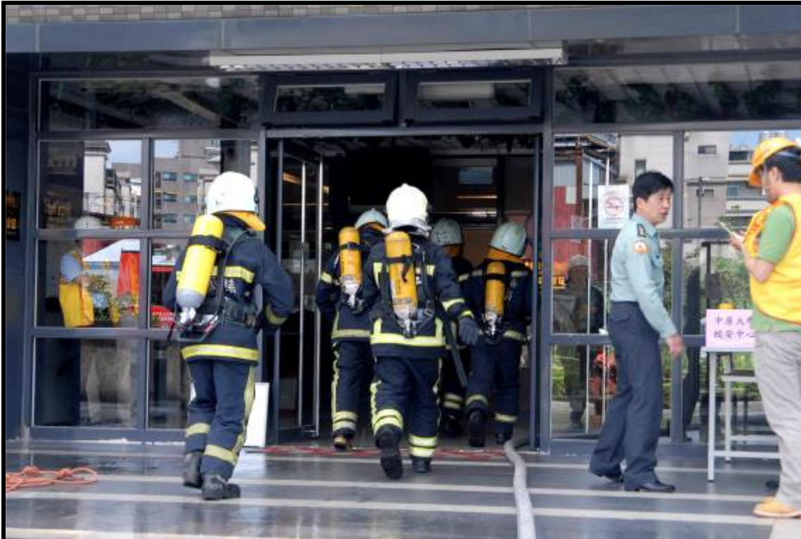
說明：火場確認人員搜索演練