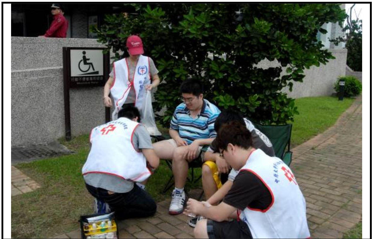
說明：防護團救護隊傷患救助演練