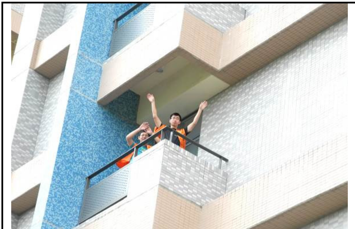
說明：高樓逃生演練-受困待救助學生