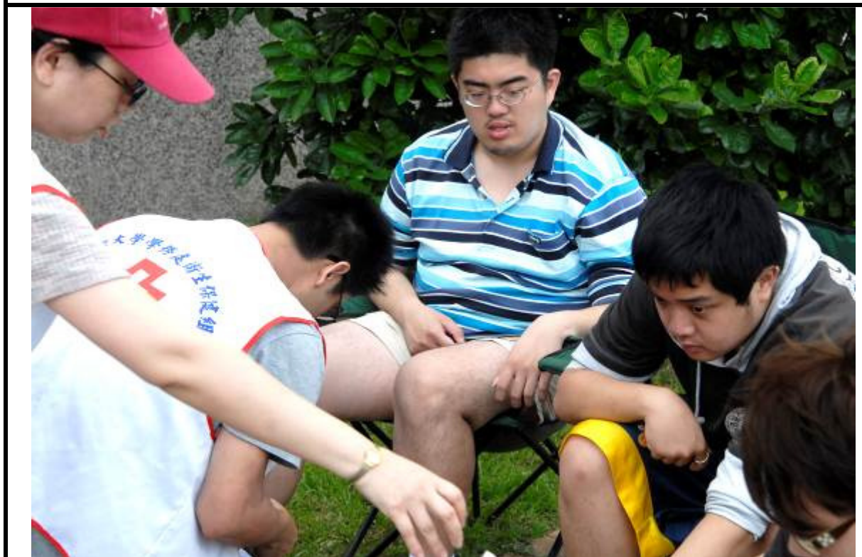
說明：防護團救護隊傷患救助演練