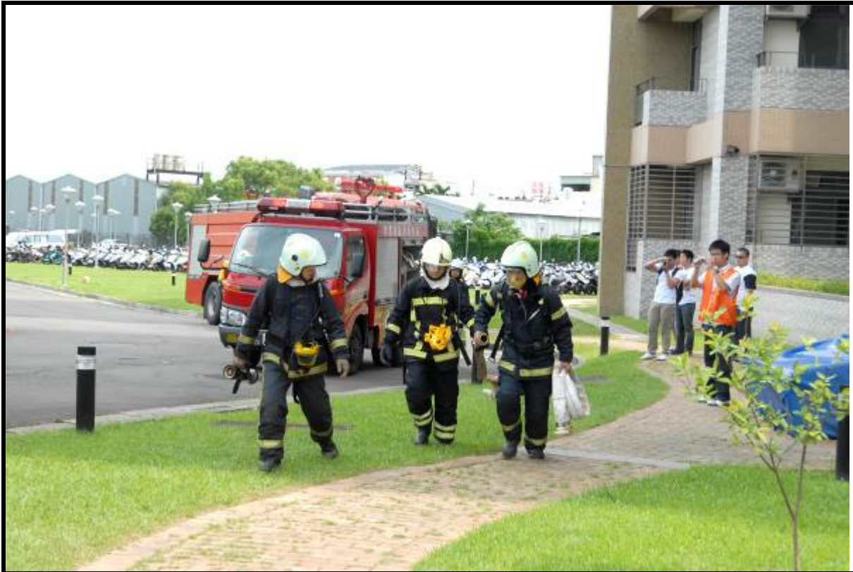
說明：災害擴大縣政府消防隊救援