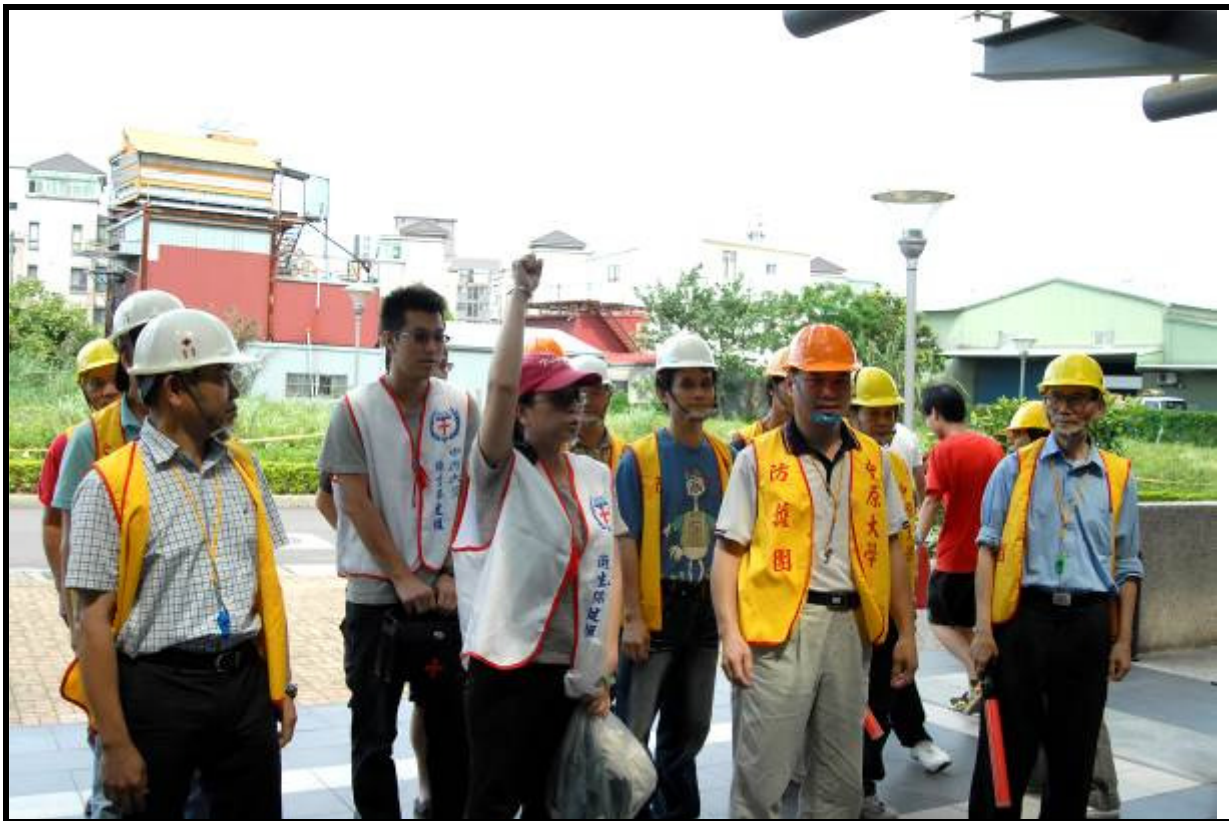
說明：防護團任務分配