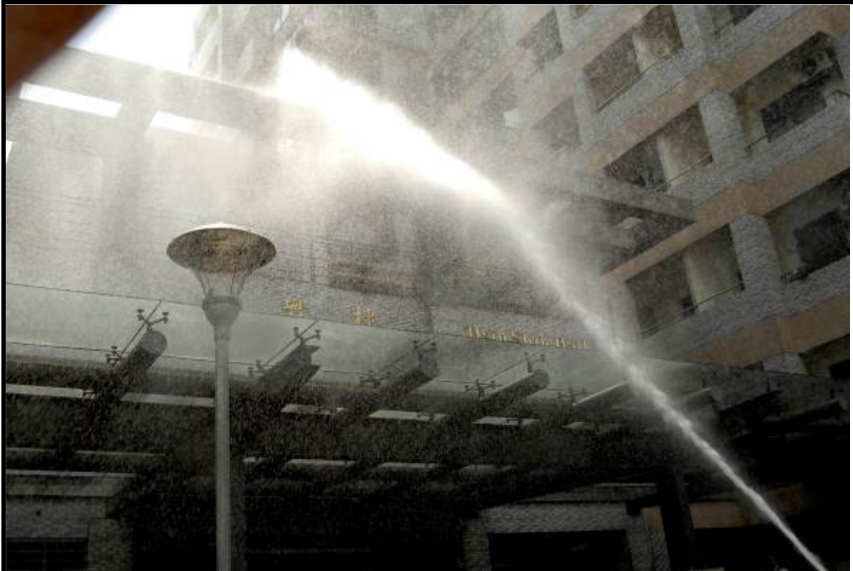
說明：縣政府消防隊滅火搶救